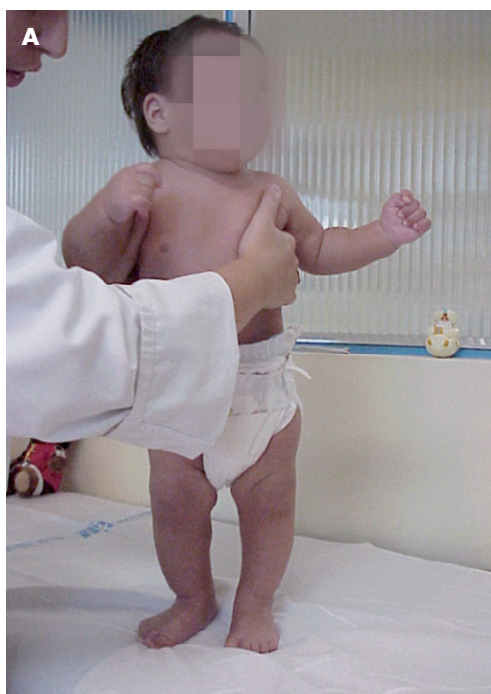
Figura 3a. Sostiene su peso en bipedestación a los 6 meses.

Observaciones para abordar la exploración del niño de 1 año. No tenemos por qué violentar al niño,