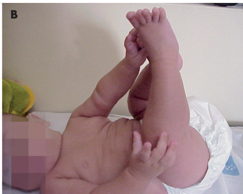
Figura 2b. El niño juega con sus pies a los 5 meses.

lateralmente en sedestación para coger objetos; desarrollará después el gateo, o “culeteo” en su caso. Se inicia la oposición del pulgar y luego la pinza. Imita gestos graciosos. Facilita el pasar su brazo por las mangas de su ropa. Comprende el significado del ¡no! y atiende a su nombre (se queda quieto atento cuando lo escucha).