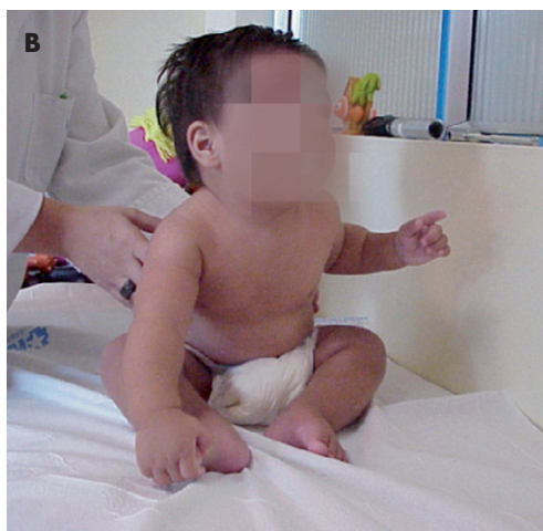
Figura 3b. Niño de 6 meses que inicia la sedestación, con apoyo aquí.