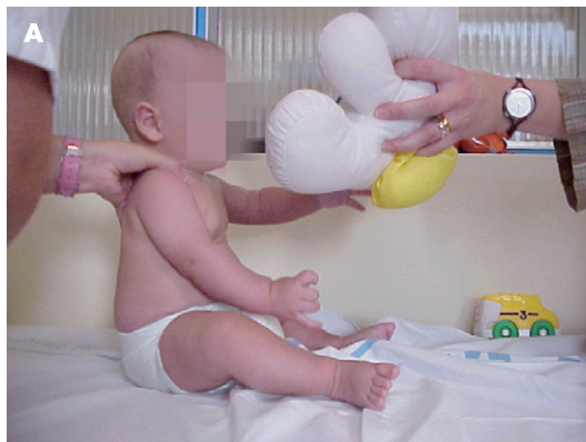
Figura 2a. Mayor proyección ante el medio del niño de 4-5 meses.