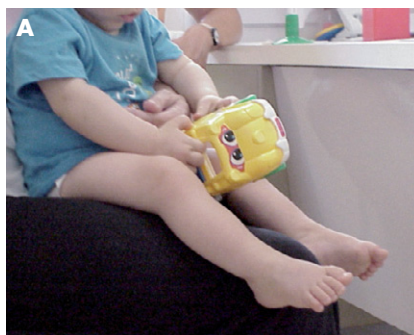
Figura 4a. Actitud de piernas bastante habitual del niño "sentado en el aire".