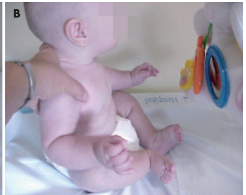
Figura 1b. Control adecuado del niño.