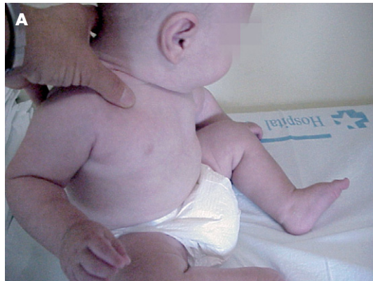
Figura 1a. Control incorrecto del niño a 3 meses.